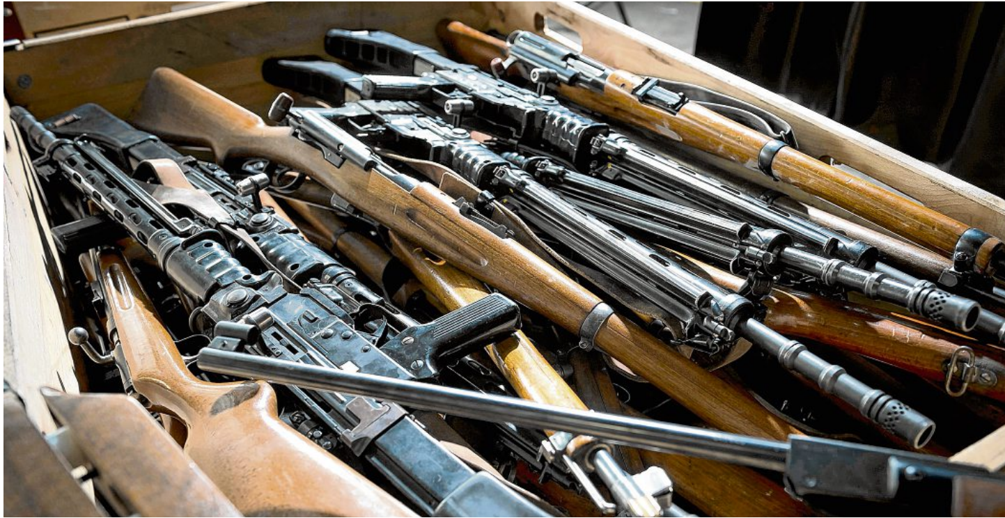
Zahlreiche Waffen in einem geheimen Lager – wie auf diesem Archivbild.

Bibliothek , Schmitten. Mi., 12. Februar, 20 Uhr.